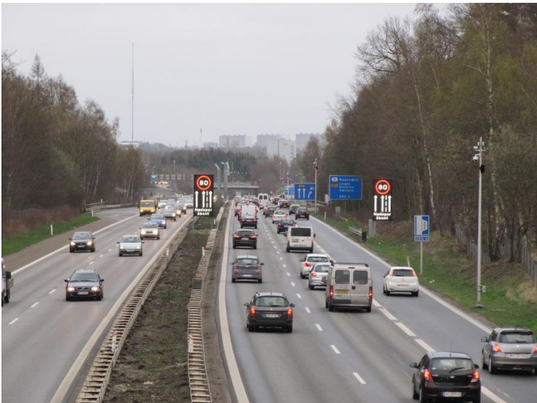
Figur 3 Hillerødmotorvejen før Bagsværd i retning mod syd

Nødsporet bliver flittigt brugt, når det er åbent, og det har løsnet trængslen og givet kortere køer, mindre sivetrafik og kortere rejsetider for de fleste trafikanter. De foreløbige observationer viser blandt andet en tidsbesparelse på op imod 20 procent på strækningen mellem Allerød og Ring 4. Vejdirektoratet gennemfører en grundigere evaluering i løbet af efteråret 2014, hvor fokus bl.a. er på effekterne på fremkommeligheden og trafiksikkerheden, trafikanttilfredsheden samt det samlede koncept vedrørende kørsel i nødsporet.