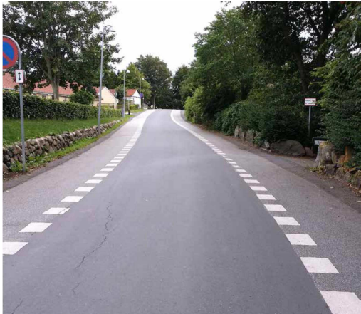
Bygaden i Jyllinge, Roskilde kommune.

Cowi har gennemført en undersøgelse om kommunernes brug af 2 minus 1 veje for Vejdirektoratet. På Vejforum 2015 vil vi præsentere hovedkonklusionerne fra undersøgelsen. Her følger resultaterne kort: