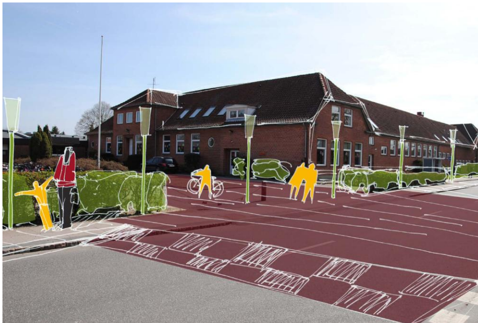
Perspektiv på baggrund af foto