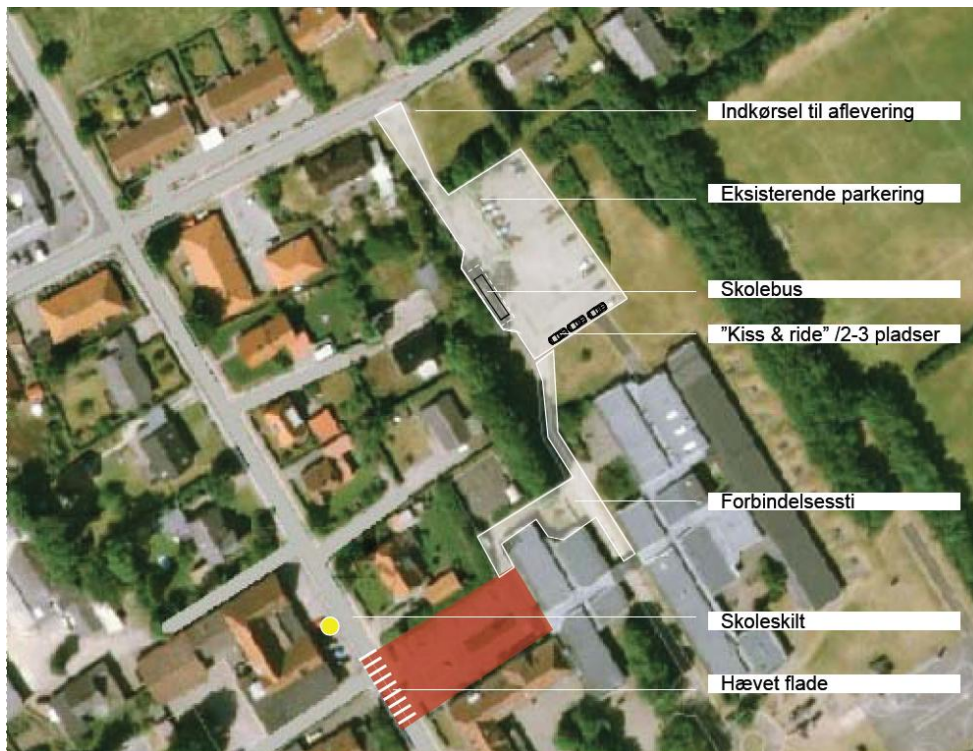
Skitse på baggrund af ortofoto