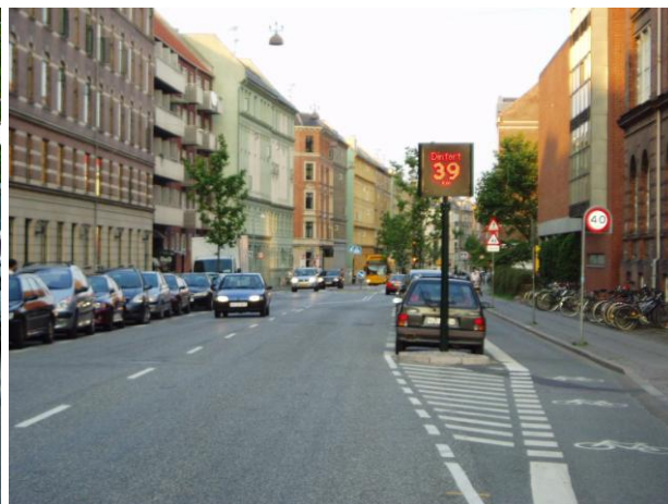
Billedtekst: Skolen på Nylandsvej