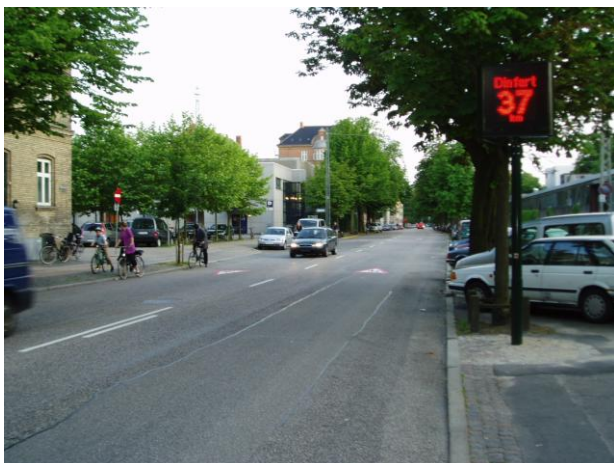
Billedtekst: Skolen ved Bülowvej

Kommunen og kommunens rådgiver udarbejdede et idékatalog med forskellige løsningsforslag og besluttede på den baggrund at gennemføre pilotprojekter ved to skoler: Skolen ved Bülowvej og Skolen på Nylandsvej. Begge skoler lå ud til trafikveje.