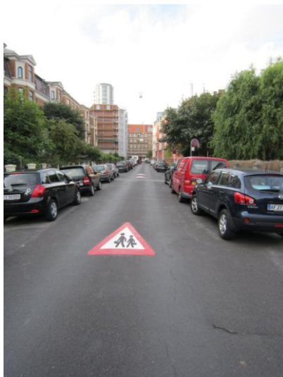
Afmærkning A22 på kørebanen på lokalvej