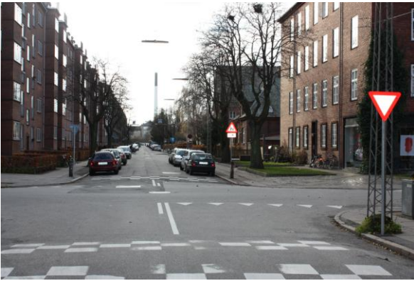
Billedtekst: Vigepligtsforhold ved Skolen på Duevej