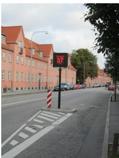
Billedtekst: Fartviser ved Tre Falke Skolen

Løsningskataloget rummede tiltag i tre kategorier: fysiske tiltag, områdetiltag og øvrige tiltag. De fysiske tiltag rummede f.eks. indsnævring og fortovsudvidelser, bump og heller. Områdetiltag var her hastighedszoner på 40 km/t. Kategorien øvrige tiltag rummede fartvisere, ændring af vigepligtsforhold, standsningsforbud foran skoler, øget belysning og afmærkning på kørebanen. Der blev anvendt afmærkning på kørebanen med A22 "børn", og der blev opsat fartvisere ved skolen.