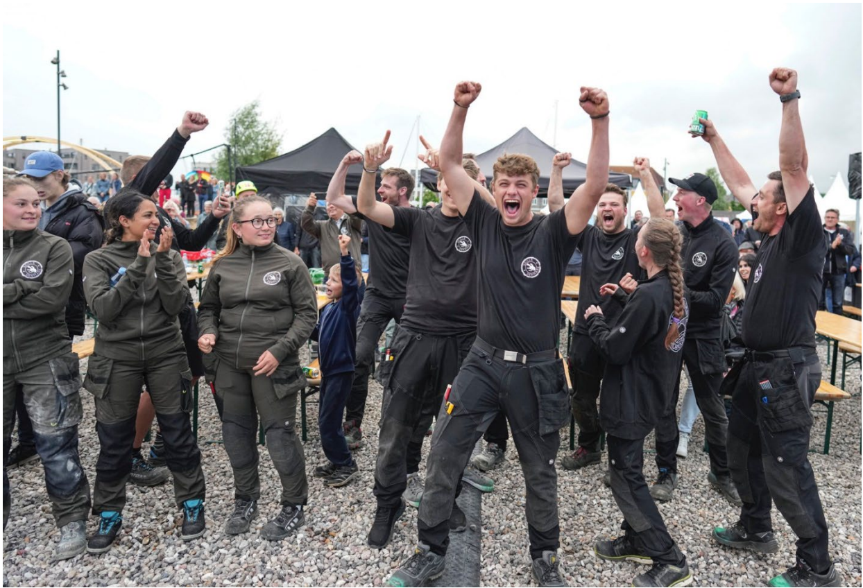
Vinderholdet Verdens Vildeste Brobyggere 2022.